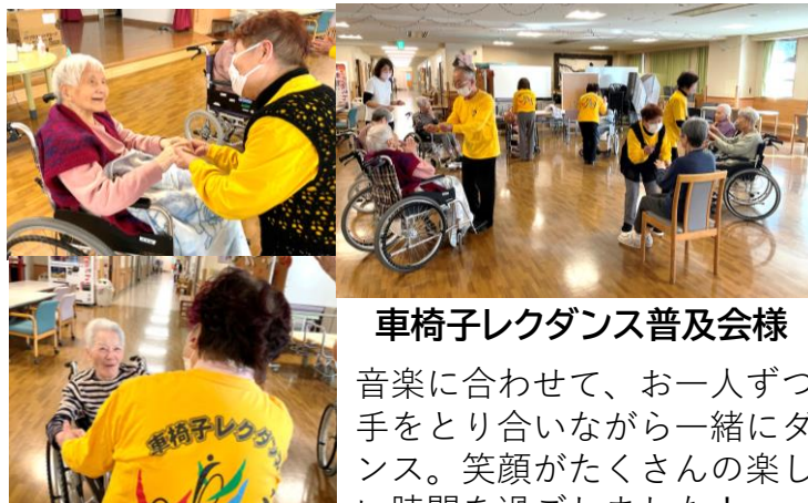
車椅子レクダンス普及会様

ピアノ演奏に合わせて素敵なコーラスを披露して下さいました♪懐かしい曲や季節の歌を聞いて、ご利用者も一緒に歌って楽しみました。