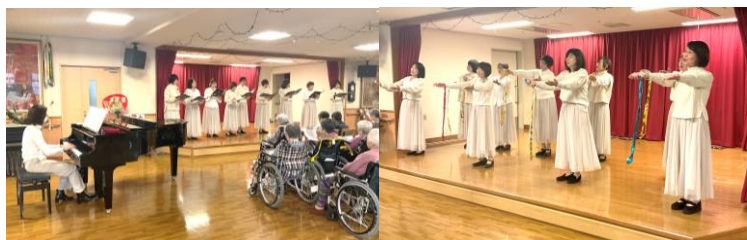
コーロシンセラ様

毎月デイサービスに歌声を届けに来て下さっていますが、1月は北3の新春の集いにも来て下さいました。拳のきいた歌声に大盛り上がり！会の終わりに北3ご利用者から感謝の手作り花束をプレゼントしました。