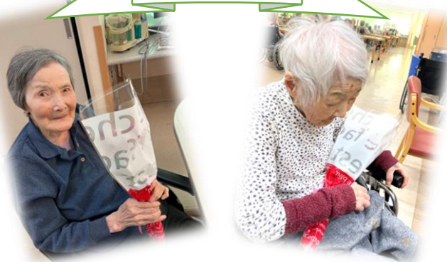
お誕生日おめでとうございます☆