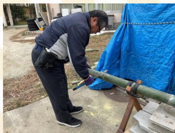
竹を斜めにカット！