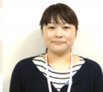
介護課長兼在宅支援課長