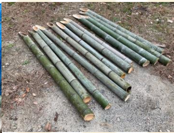
甲寿園の正面玄関とデイサービスの玄関に飾るので、合計12本用意します！！