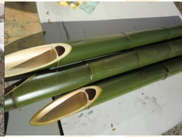
サラダ油を塗ると綺麗な緑色に！