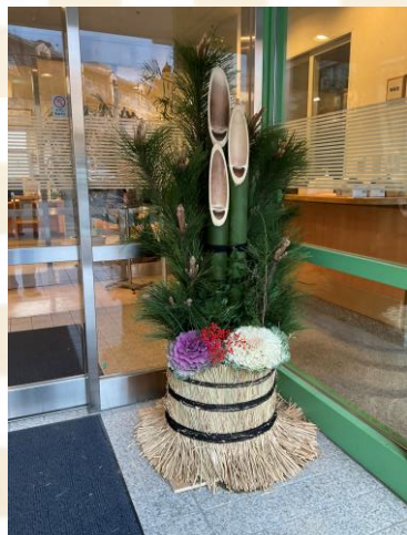
竹、松、千両など飾って完成！！