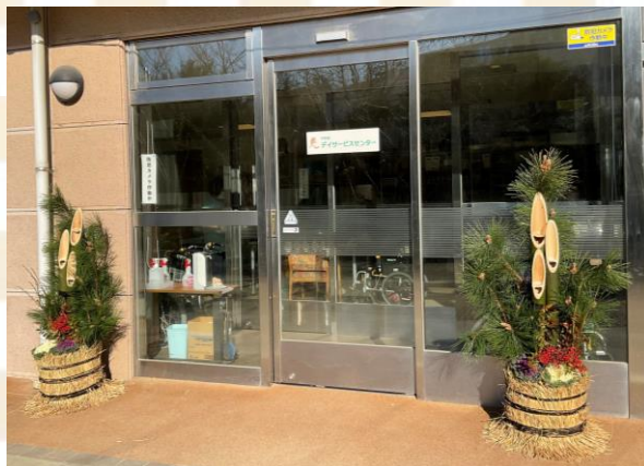
デイサービス玄関