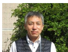
西宮すなご医療福祉センターより 事務室長