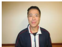
デイサービス 援助員