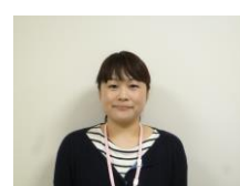
介護課長から 介護課長兼在宅支援課長