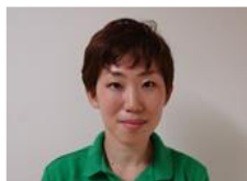
北館 2階 係長