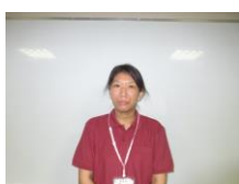
北館 2階 援助員