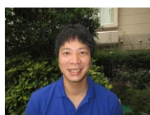
南館 3階 援助員