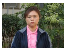
南館 2階 援助員