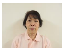
総合相談支援センターより 北館 3階 援助員