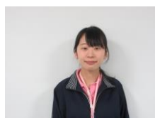
南館 2階 援助員