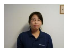
南館 2階 援助員