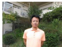
ショートステイ 援助員