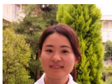
デイサービス 作業療法士