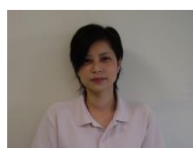
南館 2階 主任