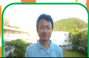
北館 3階 援助員

皆に楽しくすごして頂けるお手伝いができたらと思っています。これから宜しくお願い致します。