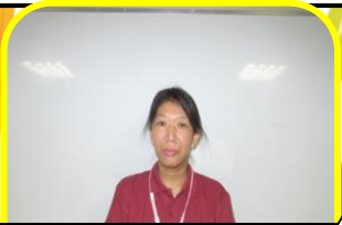
北館 2階 援助員

皆に楽しくすごして頂けるお手伝いができたらと思っています。これから宜しくお願い致します。