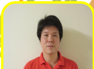
北館 2階 援助員