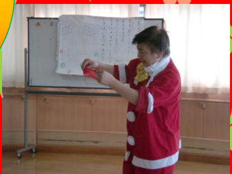
フロアでのクリスマス会