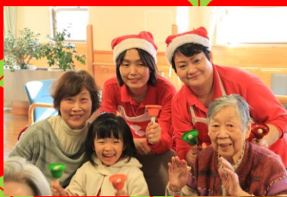
職員によるハンドベル演奏