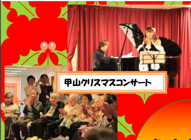
甲山クリスマスコンサート