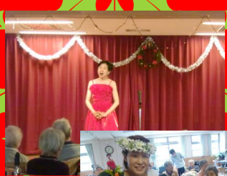
栄光教会の演奏会