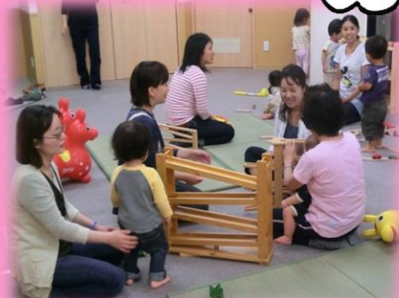
お母さん方とお話ししたり♪