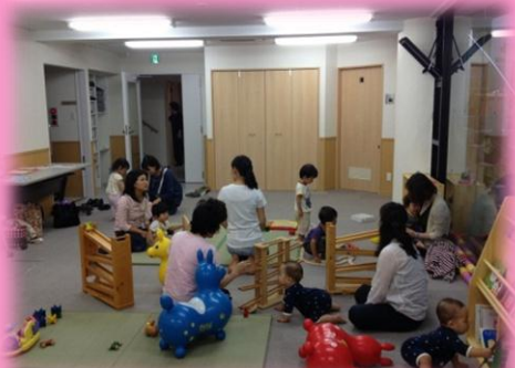
好きなおもちゃで遊びましょう♪