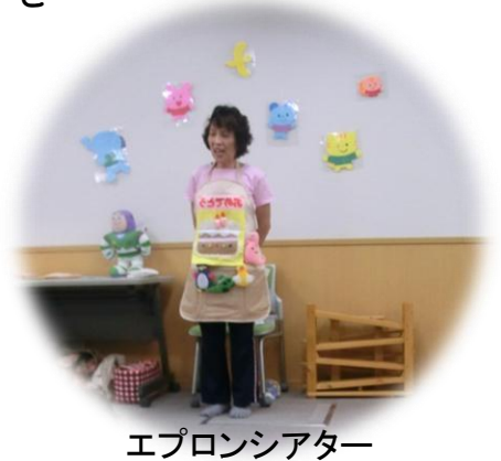
エプロンシアター

絵本に釘づけになり、笑顔いっぱいの子どもたち。とてもかわいかったです！ (柳田)